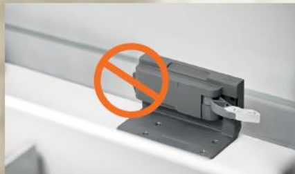
SERVO-DRIVE, o sistema elétrico de auxílio de movimento