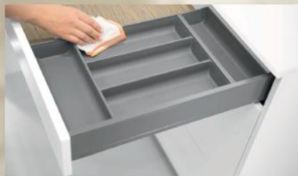
Porta-talheres AMBIA-LINE, design aço