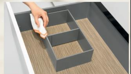
AMBIA-LINE para extensões frontais, design aço