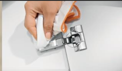
Sistemas de dobradiças