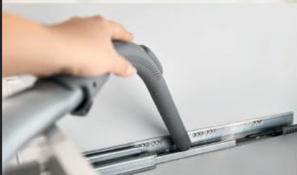
Sistemas de corredeiras